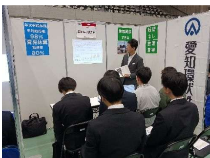
人材確保のための採用活動

また、コロナ禍により悪化した財務状況については、経済活動の回復に合わせて改善を図ってまいりましたが、今後も引き続き各種施策を着実に推進し、一層の経営改善に取り組んでまいります。