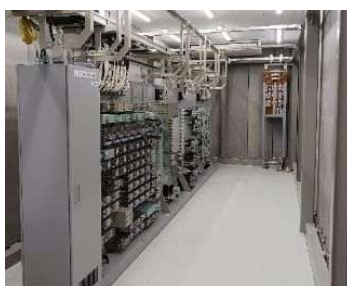
中岡崎～北岡崎連動更新