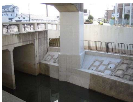
高架橋耐震補強例