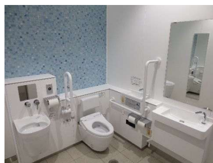
多機能トイレ設置例