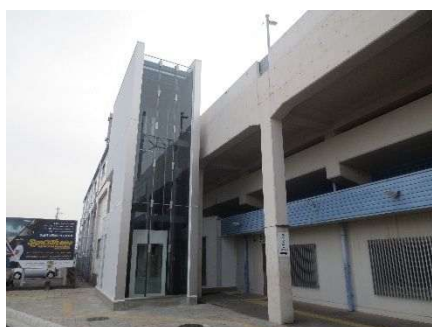
エレベーター設置例

高架駅が多く、エレベーター未設置の駅もあることから、お体の不自由なお客様や高齢のお客様、小さなお子様連れのお客様など誰もが利用しやすい駅とするため、バリアフリー法に基づく国の基準を踏まえ、国や地方自治体と連携しながら、エレベーターや多機能トイレの設置を進めてまいります。