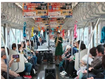
岡崎市と連携した「岡ジャズトレイン」

生産年齢人口の減少や働き方改革によるテレワークの定着などにより、通勤・通学で利用されるお客様の更なる増加を望むことが難しくなる中、新たな利用者を増やす取組が求められています。魅力的な移動目的地の情報を積極的に発信し、沿線内外から誘客を図ることが重要なことから、沿線関係団体との連携を強化して、新たな移動需要を創出してまいります。