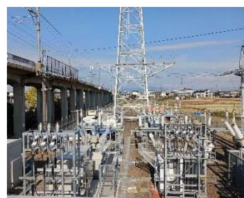
豊田変電所機器更新