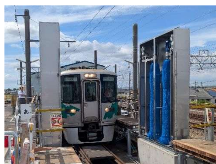
車両洗浄装置新設による屋外作業の負担軽減