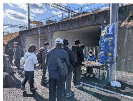
愛環ぶらっとウォーキング